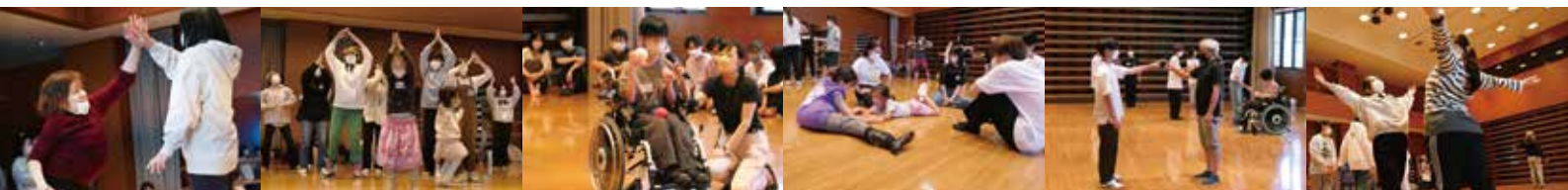
【昨年度のワークショップの様子】