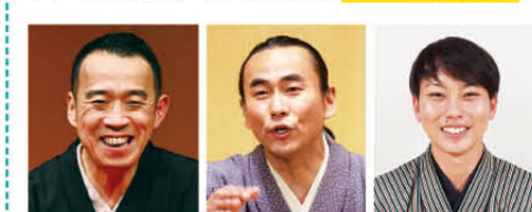
桂 南天 桂 雀喜 桂 天吾