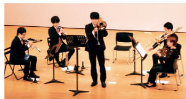
Vol.5「バラ色の金管五重奏」から

<出演> アマービレフィルハーモニー管弦楽団 全席指定/500円 ※就学前のお子様はご遠慮ください チケット: ☎/web