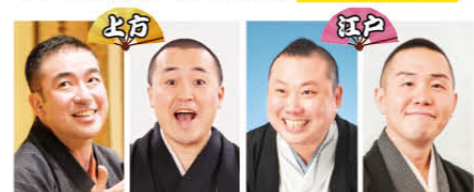
桂 雀太 桂 そうば 桂 宮治 入船亭 扇橋