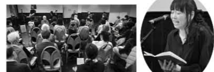
2022年度公演「観の中」より

①15:00/②19:00開演 (各30分前開場) プロのナレーターと実力派俳優!そして新進気鋭の三味線奏者と篠笛奏者があなたを物語の世界へ誘います!