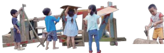
『ゆめパのじかん』のワンシーン