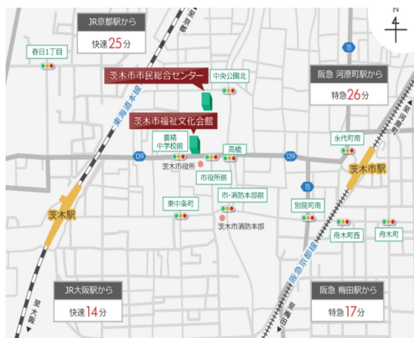
↑茨木市市民総合センター（クリエイトセンター）多目的室

○会場 6/25(土) 7/23(土)：茨木市市民総合センター（クリエイトセンター）多目的室 8/6(土)：茨木市立障害福祉センターハートフル大会議室