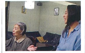
「ただただ撮っても 面白い人間よね」