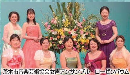
茨木市音楽芸術協会女声アンサンブル ローゼンバウム