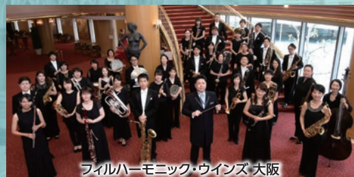
フィルハーモニック・ウインズ 大阪