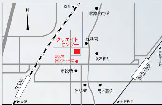
阪急茨木市駅から西へ徒歩10分、JR茨木駅から東へ徒歩12分