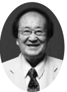
相羽秋夫（演芸評論家）

で、入門13年で真打に昇進した逸材である。武蔵野美術大学で絵画を勉強。絵心のある斬の世界は、独特のものがある。声帯模写の特技も、たい平の芸域を広げている。