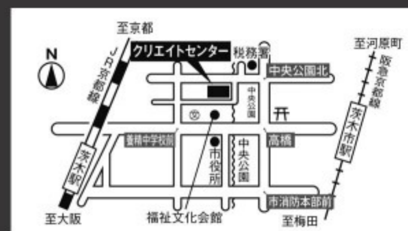
JR茨木駅から東へ徒歩10分。阪急茨木市駅から西へ徒歩12分。

◆クリエイトセンター(茨木市市民総合センター)茨木市駅前四丁目6番16号/072-624-1726