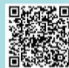
チケット購入ページ