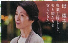
母・曜子 専業主婦として、 夫と娘たちを 支えてきた

【STORY】父の70歳の誕生日。久しぶりに帰省した娘たちに母から告げられたのは、厳格な父が認知症になったという事実だった。それぞれの人生の岐路に立たされている姉妹は、思いもよらない出来事の連続に驚きながらも、変わらない父の愛情に気がき前に進んでいく。ゆっくり記憶を失っていく父との7年間の末に、家族が選んだ新しい未来とは――。近い将来65歳以上の1/5が発症するという(出典:厚生労働省)今や他人ごとではない認知症。父の発症により、自分自身の人生と向き合う事になる家族の7年間を、あたたかな眼差しをもって優しさとユーモアたっぷりに描いた本作。刻々と変化する時代が変わることのない大切なものを問う、昭和、平成、そして新しい時代へと繋がる希望に満ちた作品が誕生しました。