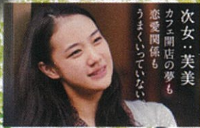
次女・美美 カフェ開店の夢も 恋愛関係も うまくいっていない

蒼井優 竹内結子 松原智恵子 山崎努 『湯を沸かすほどの熱い愛』の監督が贈る新たな愛の感動作