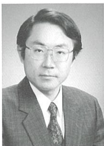
小笠原貞宗 Sadamune Ogasawara ピアノ

国立音楽大学声楽科卒業、東京藝術大学大学院オペラ科修了。第13回民音コンクール第1位受賞。イタリアに留学。《カプレーティ家とモンテッキ家》のジュリエッタでデビュー。その後《ジャンニ・スキッキ》のラウレッタ、《フィガロの結婚》の伯爵夫人、《ドン・ジョヴァンニ》のドンナ・アンナ、ドンナ・エルヴィーラ、《コシ・ファン・トゥッテ》のフィオルデリージ、《ホフマン物語》のソプラノ四役、《魔笛》のパミーナ、《蝶々夫人》のタイトルロール、《シモン・ボッカネグラ》のアメーリア、《黒船》のお吉などを演じる。1998年9月には新国立劇場・二期会共催公演《アラベッラ》タイトルロールを見事に歌いあげた。02年2月、二期会創立50周年記念公演《フィガロの結婚》の伯爵夫人で喝采を浴びた。03年1～2月、新国立劇場《アラベッラ》のタイトルロール、03年7月二期会＝ケルン市立歌劇場共同制作《ばらの騎士》の元帥夫人、相次いでリヒャルト・シュトラウスの大役を演じて好評を博した。06年錦織健プロデュース、オペラ《ドン・ジョヴァンニ》にドンナ・アンナで出演、東京の他、長崎、島根、大阪などで公演する。コンサート活動においては、ベートーヴェン《第九交響曲》をはじめ、小沢征爾指揮サイトウキネンオーケストラ、マーラー《復活》、ペーター・シュライヤー指揮ベートーヴェン《ミサ・ソレムニス》など幅広いレパートリーを持ち、国内外の著名な指揮者やオーケストラと数多く共演している。実力と華を兼ね備えた日本を代表するソプラノの一人である。国立音楽大学教授。二期会会員。