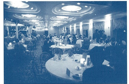
メインダイニング