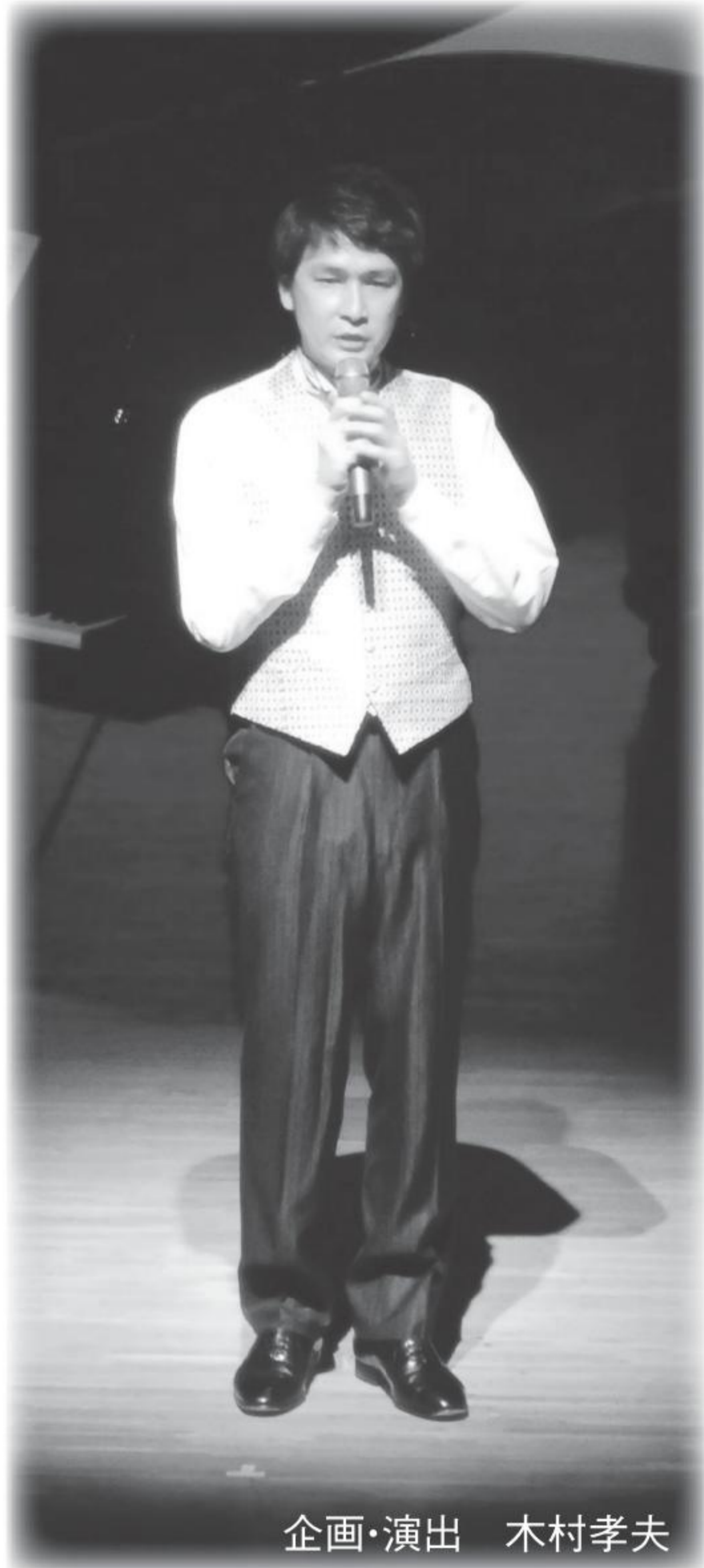
企画・演出 木村孝夫

電話が終わり、ベンが出て行ったことに気づいたルーシーは残念がる。すると、また電話が鳴る。ベンが公衆電話からかけているのだった。彼は「結婚してほしい」と告げ、ルーシーは「もちろん」と答える。ふたりは出張中、毎日電話することを約束して、声をそろえてルーシーの電話番号を確認する。