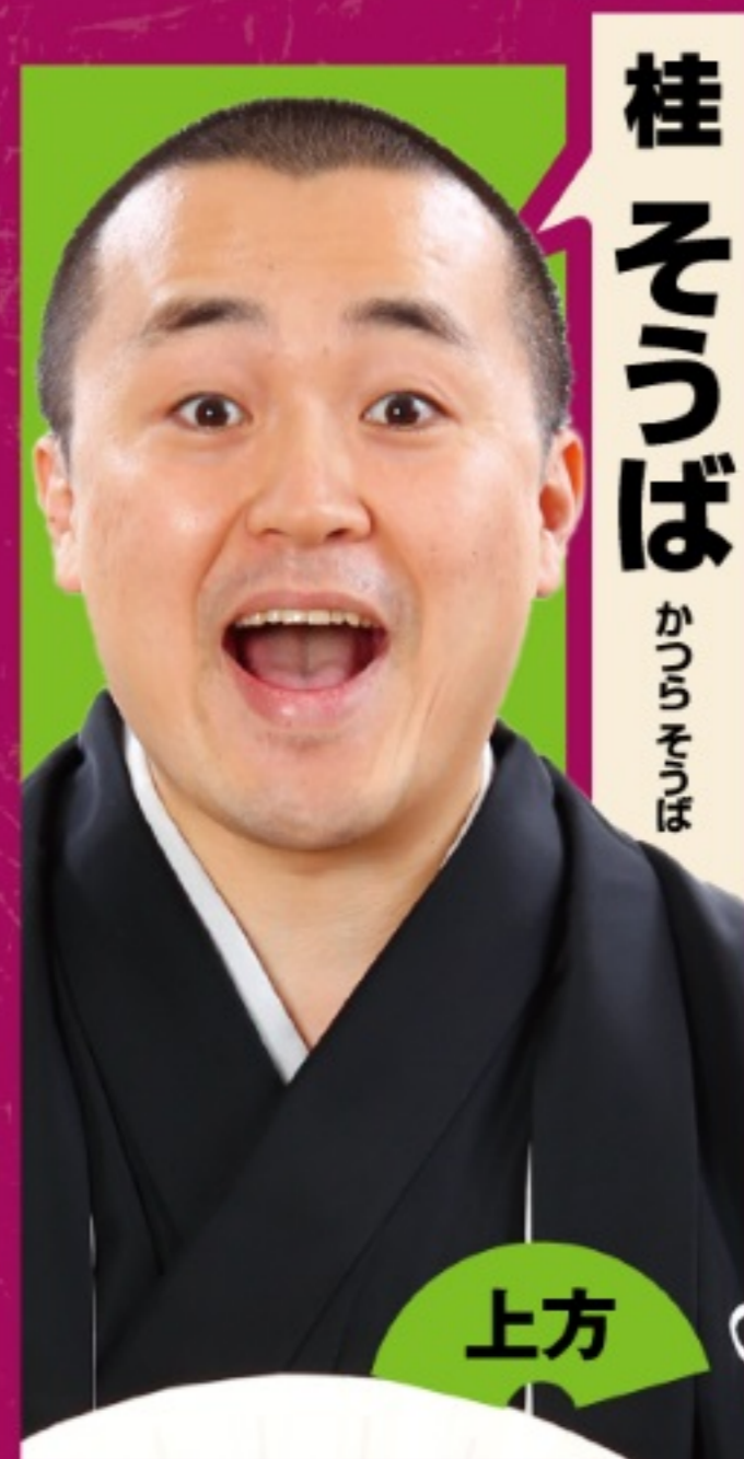
桂そらば かいらそらば