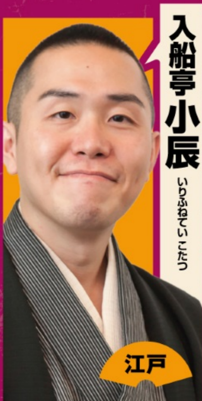
入船亭小辰 いりせんやこうたる