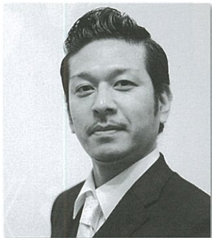
ドン・マニフィコ 東 平間