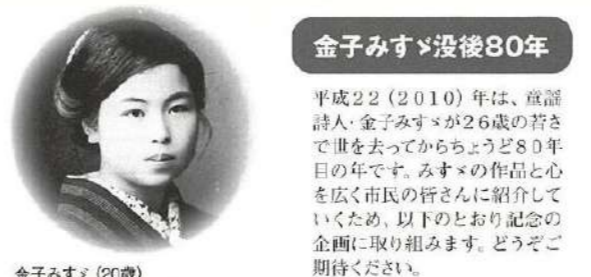
金子みすゞ(20歳)