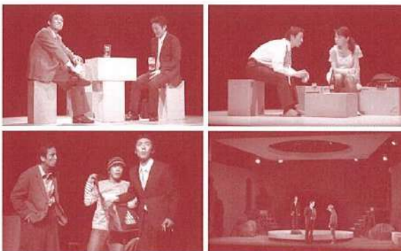
「流星ワゴン」より