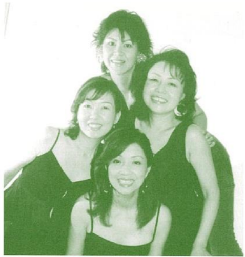
アンサンブル・レゾナンス