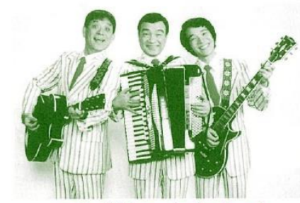
漫才/横山ホットブラザーズ