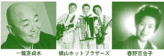
一龍齋貞水 横山ホットブラザーズ 春野百合子

東京から「講談」界初の人間国宝、一龍齋貞水来演、迎え打つ上方は、「浪曲」界の第一人者、紫綬褒章受章の春野百合子、音楽「漫才」のリーダー、文化庁芸術賞受賞の横山ホットブラザーズ— 名人芸の真髄をお楽しみください!