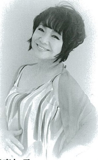
渡辺真知子 Machiko WATANABE

ウエストコーストのテイストにのせておおくりする ジャズスタンダード、ポップス、歌謡曲—— 鍛え抜かれた伝統のアンサンブルと唯一無二の歌声が 茨木のトワイライトを彩る！