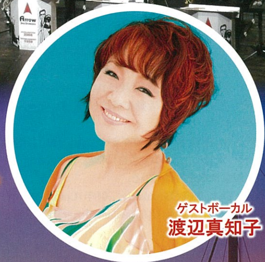
ゲストボーカル 渡辺真知子