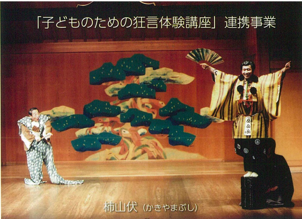
柿山伏 (かきやまぶし)