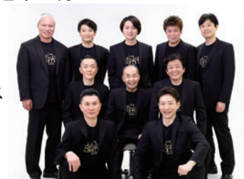
ザ・ニューズペーパー