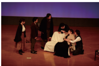
Vol.32《ラ・ボエーム》より