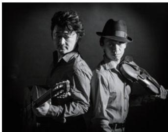
ジュスカ・グランパール