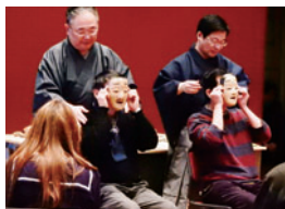
昨年度の体感講座の様子

各日14:00~16:00 (13:45開場) クリエイトセンター・多目的ホール