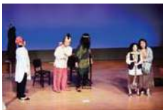
Vol.26《アマールと夜の訪問者》より