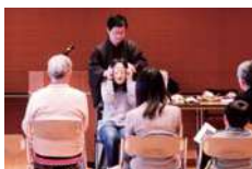
昨年度の体感講座の様子