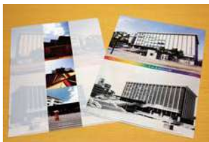
メモリアルクリアファイル