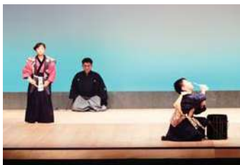
昨年度の体験講座の様子