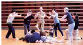
昨年度のワークショップの様子

※動きやすい服装で、上履き、タオル、水分補給の飲み物をご持参ください。更衣室はございます。