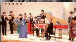
テレマン室内オーケストラ