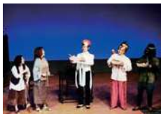
Vol.26《アマールと夜の訪問者》より

2月4日(土) 14:00開演(13:30開場) クリエイトセンター・センターホール