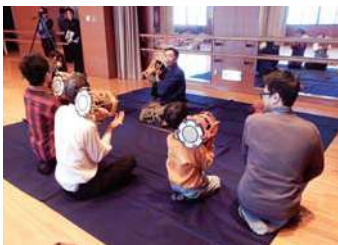
昨年度の体感講座の様子