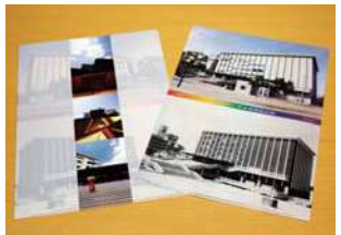
メモリアルクリアファイル