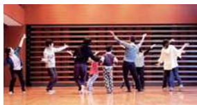
昨年度のワークショップの様子

※動きやすい服装で、上履き、タオル、水分補給の飲み物をご持参ください。更衣室はございます。