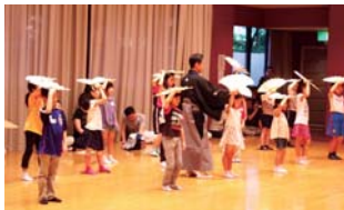
昨年の体験講座の様子