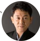
作・演出 茂山千三郎