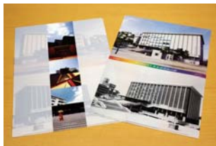
メモリアルクリアファイル