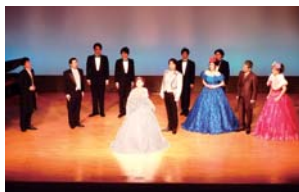
Vol.25 《チェネレントラ》より

※茨木市観光協会、茨木市勤労者互助会、OSAKAメセナカード各会員の皆様には、主催公演のチケット料金を10%割引いたします。割引は本人様に限り、この取り扱いは財団窓口のみです。 ※主催公演の発売初日は電話・インターネット受付のみです。