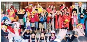
平成26年度「お練り」の様子