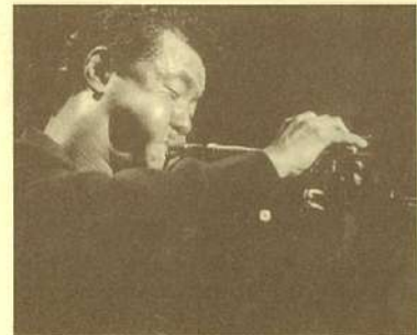
トランペット：日野皓正

●7月10日【日】19:00開演(18:30開場) ●ユーアイホール大ホール ●1階席4,000円 2階席2,000円 全席指定 65歳以上、18歳以下、障害者及びその介助者は500円引き ※就学前のお子様のお入場はご遠慮ください 夏の夜、豪華2大ゲストがおくるジャズプレゼント!