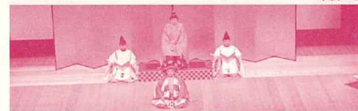
妙音へのへの物語