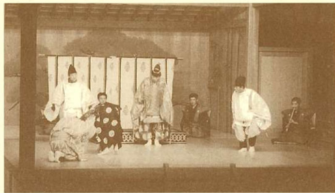
「妙音へのへの物語」より

尺八や鼓の演奏を入れた云わばミュージカル仕立ての新しい狂言様式芝居です。1978年、当時の「狂言小劇場」で初演、以後再構成され、1997年「四万十川演劇祭」での再演等、10回上演されています。どうぞお楽しみに!